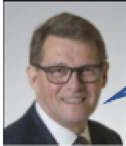
Matti Vanhanen KESK

”Laista jätettiin pois säädös siitä kenelle asunnot kuuluvat sitten kun lainat on maksettu pois.”